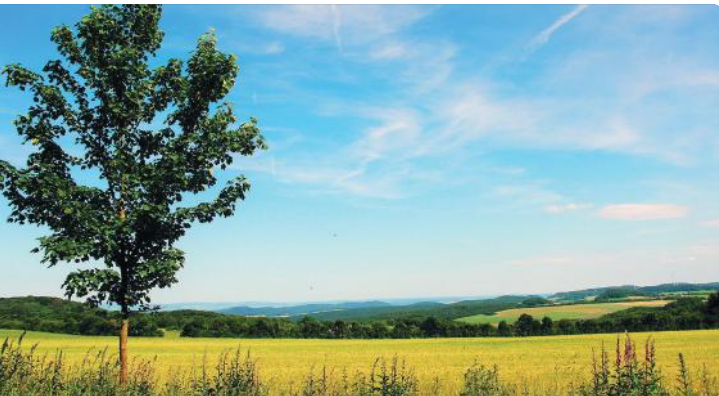
1 PANORAMA Siebengebirge

Unterwegs streift die Route die vier Ortsteile Spessart, Hannebach, Wollscheid und Heulingshof – reizvoll betten sich diese in die malerische Landschaft der Vulkanregion ein. Kleine Auszeit - bequeme Waldliegen laden bei herrlichen Weitblicken in die von Höhenzügen und Tälern geprägte Osteifel zum Verweilen und Durchatmen ein.