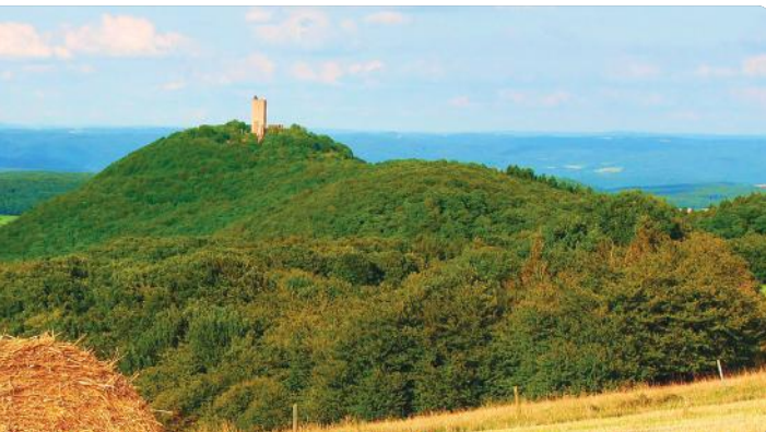
4 PANORAMA Westerwald