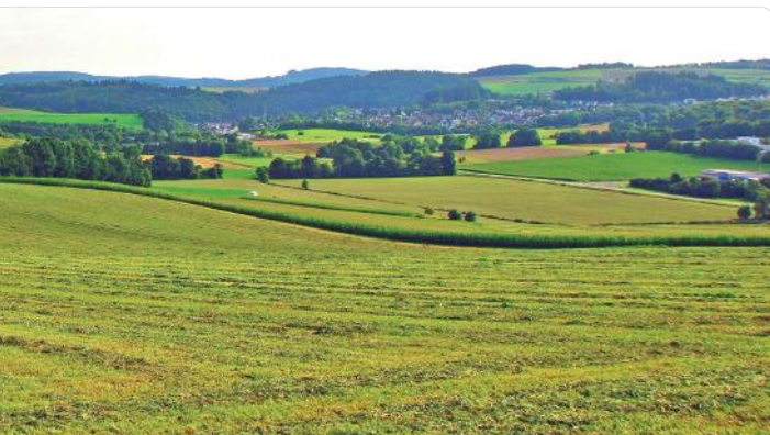
5 PANORAMA Hoheifel