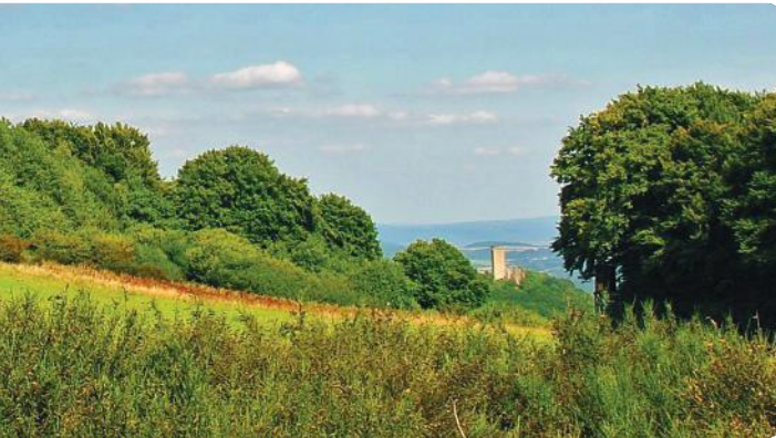
3 PANORAMA Olbrück