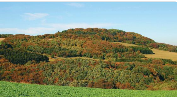
2 PANORAMA Perler Kopf